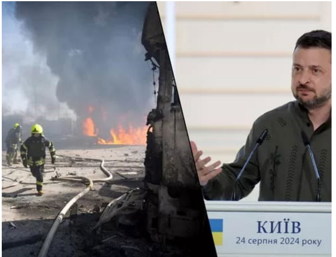
Ataques recentes têm sido particularmente devastadores, afetando infraestruturas essenciais da Ucrânia

Este apelo ocorre em meio a um cenário de intensificação dos combates, onde a Ucrânia continua a resistir bravamente, mas enfrenta desafios significativos devido à superioridade militar russa. A solidariedade e o apoio da Europa são vistos como elementos chave para ajudar a Ucrânia a resistir e eventualmente superar a agressão.