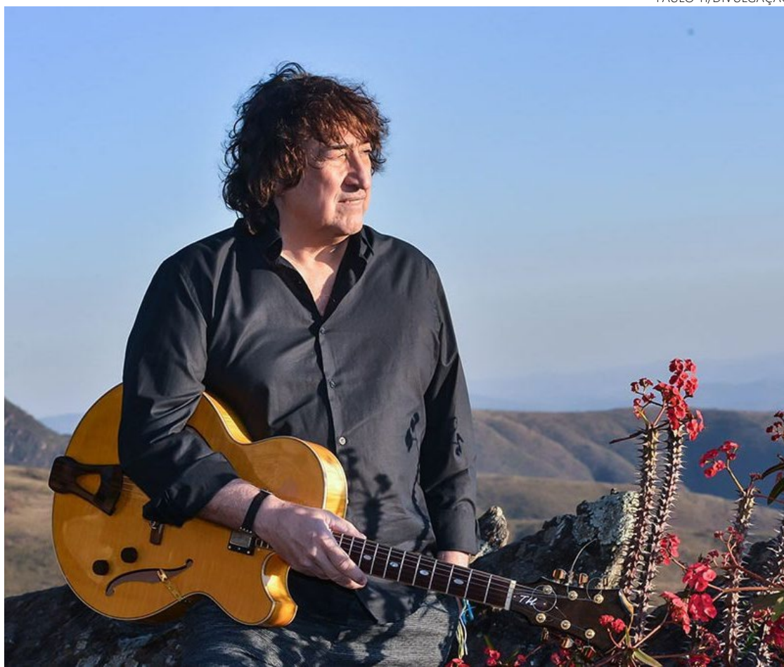
Debussy da guitarra: músico é conhecido pela habilidade no campo harmônico

Quanto ao período mais fértil de sua vida em matéria criativa, o guitarrista mineiro nem pensa: “anos 70.” Já tinha adquirido, nessa época, bagagem artística importante, pois escutara na meninice Miles Davis e Claude Debussy. As complexas construções harmônicas de João Gilberto e Tom Jobim não lhe pareciam algo impossível. “Conhecia de