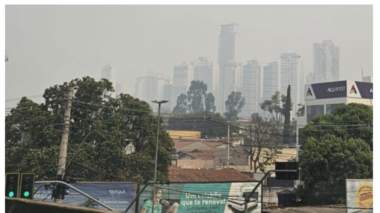
Em declínio, a umidade relativa do ar pode chegar a 22%