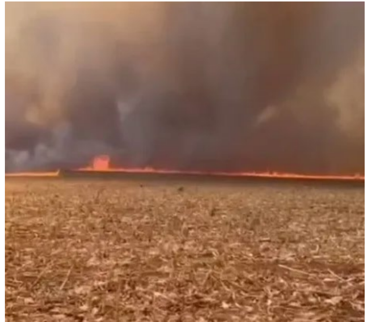
Suspeito foi encontrado ateando fogo no pasto de uma propriedade rural na BR-158

Força tarefa do Corpo de Bombeiros e 50 produtores rurais em Caiapônia foi formada para combater as queimadas na região