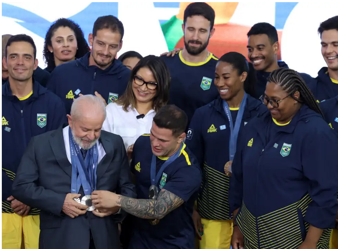
Lula recebe atletas dos Jogos Olímpicos de Paris 2024, no Palácio do Planalto

Lula também criticou o despreparo do país para fomentar o esporte desde a base, com