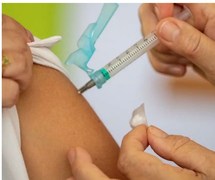
A bronquiolite é uma infecção comum que inflama as vias aéreas menores nos pulmões

A vacina da Moderna, que já havia recebido aprovação nos Estados Unidos, demonstrou eficácia significativa nos ensaios clínicos, oferecendo uma nova ferramenta para a prevenção da bronquiolite. A decisão da UE foi baseada em dados robustos que mostraram a capacidade da vacina de reduzir significativamente os casos de hospitalização e complicações graves associadas à infecção pelo VSR. Especialistas em saúde pública saudaram a aprovação, destacando que a disponibilidade de uma vacina eficaz pode aliviar a pressão sobre os hospitais e reduzir a necessidade de tratamentos intensivos