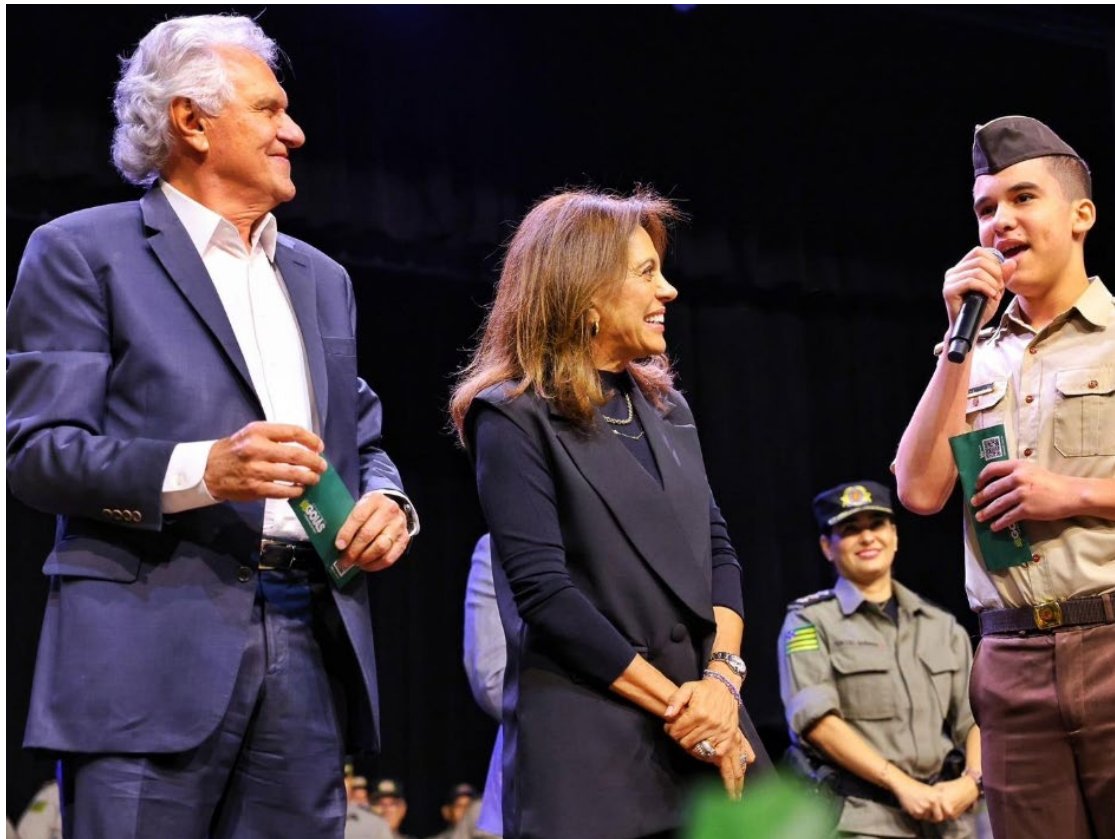
Governador Ronaldo Caiado e Gracinha entregam cartões do programa Bolsa Uniforme para alunos dos colégios militares

Ronaldo Caiado explica que o programa contribui para a economia das famílias. Até então, os pais custeavam o uniforme. “Não se pode de maneira nenhuma admitir que crianças e jovens sejam limitados por questões financeiras. Cabe ao Estado financiar e contribuir para a educação”, afirmou o go-